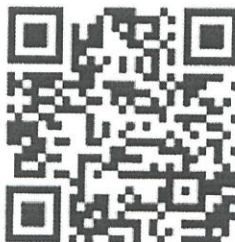
Рисунок 6 — Рекомендации по проведению кинопоказов в профилактике

Среди фильмов по тематике противодействия терроризму можно использовать следующие фильмы: «Беслан. Память» (Россия, 2014 г., возрастное ограничение: 12+), «Кавказский пленник» (Россия, 1996 г., возрастное ограничение: 18+), «Я не террорист» (Узбекистан, 2021 г., возрастное ограничение: 18+), «Отель Мумбаи: противостояние» (США, Австралия, 2018 г., возрастное ограничение: 18+) и т.д.