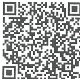
Рисунок 4 — Сценарий для проведения дебатов «Идеология радикализма»

Первая команда всегда будет представлять сторону радикальной идеологии. Задача команды студентов – найти контраргументы тех радикальных и спорных тезисов, которые будет озвучивать первая команда. Тем самым, участники будут вынуждены критически рассматривать постулаты радикальных идеологий, искать в них логические ошибки, несоответствия – самостоятельно приходить к выводу о деструктивности любой радикальной идеологии (см. рисунок 4).