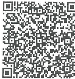
Рисунок 7 — Сценарий тематической викторины с примерами вопросов

В каждом из перечисленных мероприятий важно отслеживать активность участников, высказываемыми ими мнения, их настрой в целом. На таких мероприятиях необходимо присутствие психолога для фиксации активности и оценки их поведения.