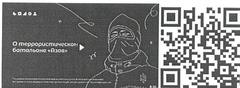
Рисунок 2 – Видеоролик, разъясняющий причины признания организации террористической

3) батальон «Азов» (см. рисунок 2) — военизированное подразделение, созданное в 2014 году на базе футбольных ультрас и праворадикалов Харькова и некоторых других украинских регионов. «Азовцы» причастны к массовым военным преступлениям против мирного населения Донбасса и Украины. Сама организация признана террористической в России по решению Верховного Суда Российской Федерации от 02.08.2022 г. № АКПИ22-411С. Батальон «Азов» входит в состав Национальной гвардии, подчиненной Министерству внутренних дел Украины. С 2014 года боевики батальона «Азов» систематически пытали, убивали и грабили мирных жителей ДНР, ЛНР и востока Украины. У батальона неонацистская идеология. Это проявляется в расизме, русофобии, восхвалении наследия Третьего рейха и украинских коллаборационистов в годы Второй мировой войны. Среди боевиков в том числе распространены радикальные неоязыческие взгляды. Свою идеологию боевики активно распространяют среди украинской молодежи через лагеря подготовки, печатную продукцию (комиксы, книги) и интернет-сообщества. С «Азовом» активно сотрудничает большое количество праворадикальных течений на Украине (признанных в России экстремистскими организациями), например, «Правый сектор», «УНА-УНСО», организация «Тризуб им. Степана Бандеры» и т.д.