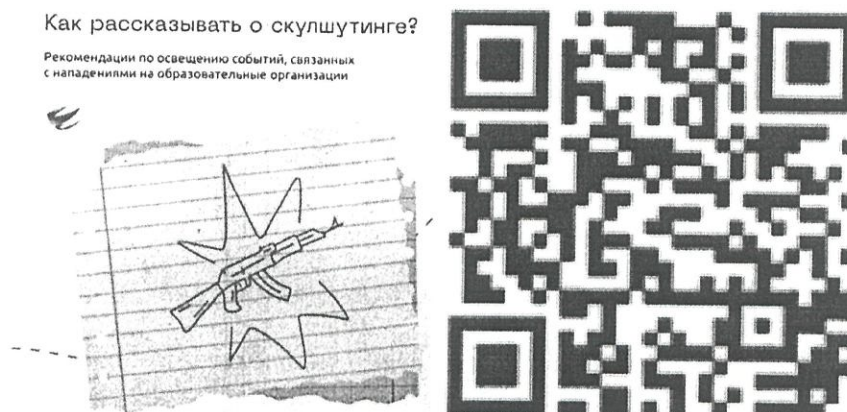
Рисунок 1 — Рекомендации по освещению в СМИ темы скулшутинга

1) «Колумбайн» (другое название «Скулшутинг») — террористическая организация, признанная таковой по решению Верховного Суда Российской Федерации от 02.02.2022 г. № АКПИ21-1059С. Идейная основа – ненависть в отношении образовательных организаций, преподавателей и обучающихся, а также прославление нападавших ранее на образовательные организации. За последние 5 лет в России участились случаи нападений учащихся на учебные заведения. Во многих случаях «скулшутинга, нападавшие в определённой степени копировали сценарий преступления, совершенного в 1999 году учениками школы «Колумбайн» - Э. Харрисом и Д. Клиболдом, а также сценарии других нападений, совершенных уже в России (например, нападение В. Рослякова в 2018 году на Керченский политехнический колледж). Следует помнить, что одна из причин скулшутинга – травля со стороны обучающихся и учителей. Часть нападавших ранее подвергались насилию в классе, группе и в образовательной организации в целом. Поэтому руководству образовательных организаций следует уделять большое внимание ранней диагностике проблем и профилактической работе. Отдельно следует решать важный вопрос недостаточного внимания родителей к проблемам несовершеннолетних (см. рисунок 1).