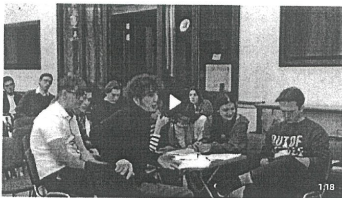
Дебаты «Идеология радикальных организаций» 1 898 просмотров

В рамках дебатов можно: развенчивать мифы, декларируемые представителями радикальных идеологий для вербовки; развивать навыки критического мышления и ведения дискуссии; формировать в целом антитеррористическое сознание и активную гражданскую позицию. Рекомендуется для мероприятия вовлекать не более 20 человек (см. рисунок 5).